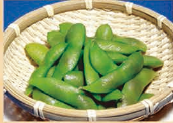
枝豆 273円 +税