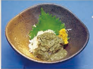
おつまみかに味噌 382円 +税