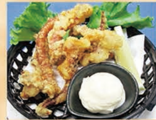
いかげその唐揚げ 328円 +税