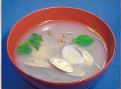
アサリのお吸い物 273円 +税