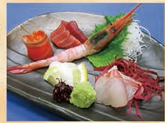
お刺身ちよい盛り 591円 +税