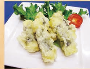
チーズの磯辺揚げ 328円 +税