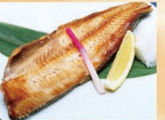
ほっけの一夜干し 791円 +税