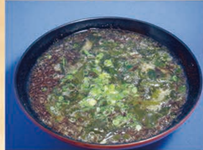
海藻の味噌汁 273円 +税