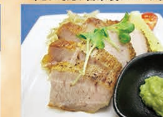
豚とろスモーク 546円 +税