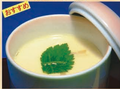
自家製茶碗蒸し 228円 +税