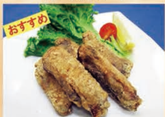
スパイシー手羽の唐揚げ 382円 +税