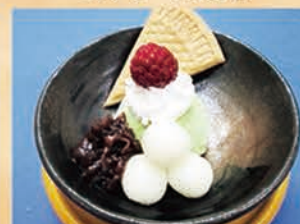
白玉抹茶アイス 328円 +税