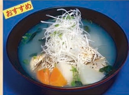
あら汁(日替わり) 273円 +税