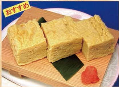
自家製たまご焼き 228円 +税