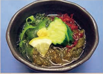
もずく酢 228円 +税