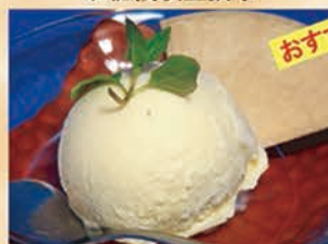
バニラアイス 273円 +税