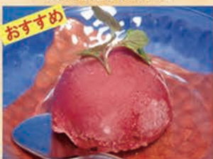
カシスシャーベット 228円 +税