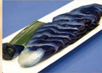
ナスの一本漬け 328円 +税