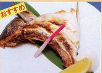
本日のかま焼き 428円 +税