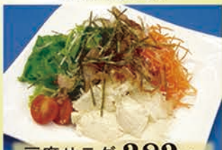
豆腐サラダ 382円 +税