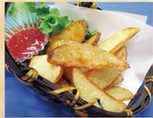
ポテトフライ 228円 +税