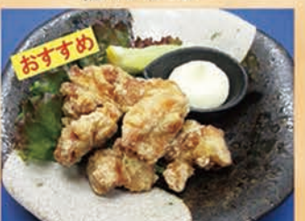
鶏の唐揚げ 328円 +税