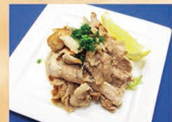
豚バラ葱塩焼き 546円 +税