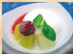
杏仁豆腐 273円 +税