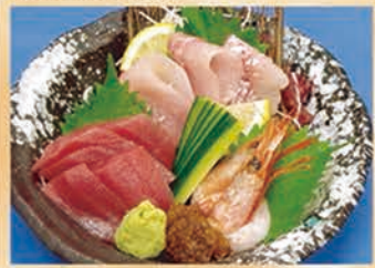
三点盛り合わせ 1137円 +税