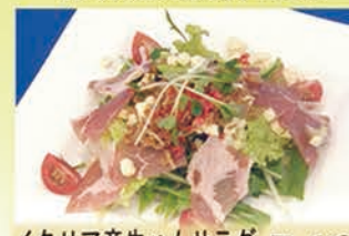
イタリア産生ハムサラダ 546円 +税