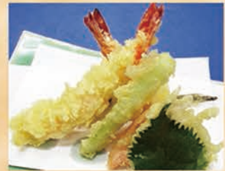
天ぷら盛り合わせ 591円 +税