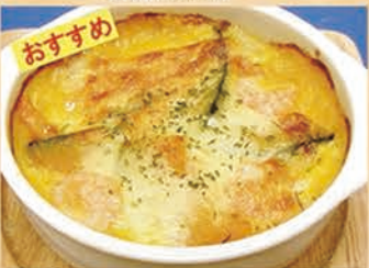
季節のグラタン 428円 +税